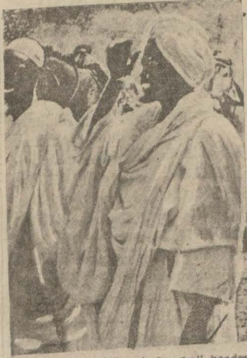
"SALAAM ALEIKUM": A Shoghali headman who was extremely well disposed toward the English travellers, giving the customary Muslim greeting on their approach.

Papa İtalyaya gidecek olan papazlara Iacobisin gösterdiği bütün kahramanlığı ve yüksek feragati taklit etmeye çalışmalarını tavsiye etmiş, İtalya - Habeş ihtilâfını