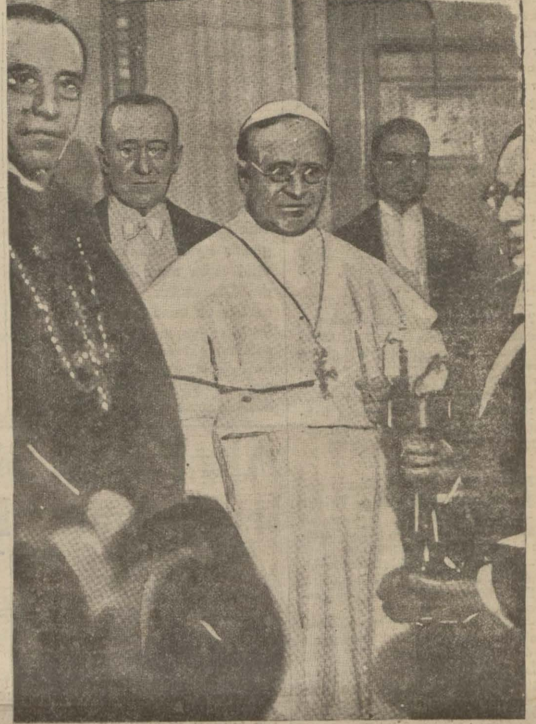
Papa, İtalyan - Habeş devasına resmen karıştı

Not Habeşistan, din itibarıyla Hıristiyan ise de bu hususta Mısır'daki (Devamı 8 inci yükde)